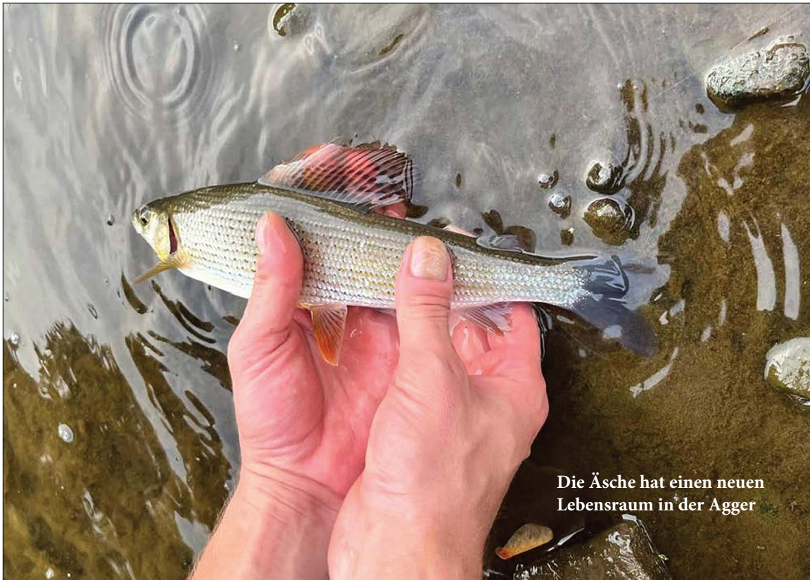
Die Äsche hat einen neuen Lebensraum in der Agger